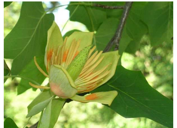
jehličnanem. V těch zahradních parcích obdivuji jasnozřivost tehdejších zakladatelů s jakou předvídali při vysazování malých stromků nynější půvabně