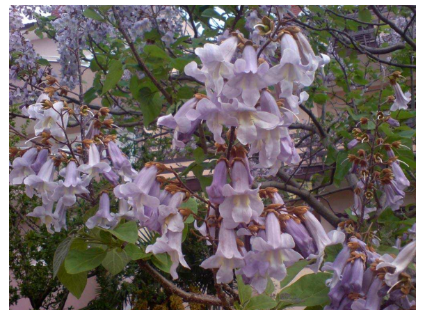
dřevin z různých částí světa u nás roste včetně metasekvojí či svídy japonské . Nechybí ani pradávny jinan dvoulaločný o kterém málokdo ví, že je vlastně

Všimli jste si, že pozdní jaro a začátek léta je nejkrásnější čas plný květů. Probuzená, svěží flora na nás útočí pestrou paletou barev i vůní. Tu všudypřítomnou energii přírody nevnímá jen opravdový zatvrzelec. Začíná to obvykle ovocným stromovím, azalkami a rododendrony, pokračuje šeříky, kaštany a vrcholí lípami, pivoňkami a růžemi. Každý z nás má svá oblíbená místa, kam za květy chodí. Pro ty, kteří by snad ještě tápali, zkuste botanickou zahradu v Tróji a park kolem zámku v Průhoncích. Tomu tam konkuruje i Dendrologická zahrada na druhé straně dálnice. A pak zámecké a pražské hradní zahrady. Máte-li štěstí narazíte i na relativně exotické rozkvetlé stromy jako modrofialové pawlonie , bílé katalpy nebo žluto-oranžový liliovník tulipánokvětý . Vůbec je s podivem, kolik exotických