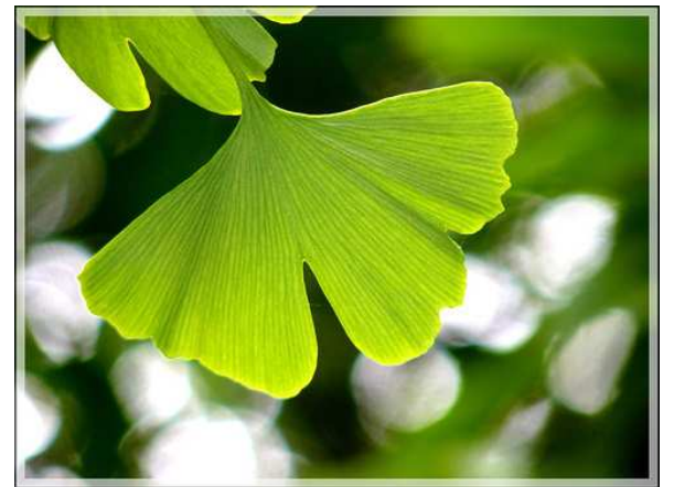
průhledy vzrostlým mohutným stromovím. Vyžadovalo to jistě i pokoru, protože dobře věděli, že ten výsledný pohled již jim dopřán nebude. Přesto je jejich dílo nadčasové. Tak si to užijte.