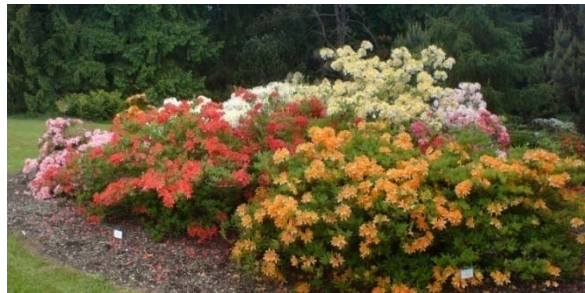
Letošní jaro květy nešetřilo

Víš Jacku to je nějak takhle. Stádo bizonů se může pohybovat pouze tak rychle, jak běží nejpomalejší bizon. Když je stádo napadeno predátorem, jsou to ti nejpomalejší a nejslabší jedinci, co jsou zabiti jako první. Tato přírodní selekce je dobrá pro celé stádo, protože rychlost celé skupiny vzrůstá s tím, jak jsou slabší jedinci zabíjeni. Zhruba ve stejném principu lidský mozek může fungovat pouze tak rychle, jako jeho nejpomalejší nervová buňka. Jak víme požívání alkoholu zabíjí mozkové buňky, ale zabíjí ty nejslabší a nejpomalejší jako první. Tím pádem pravidelná konzumace piva eliminuje slabé a pomalé buňky, čímž dělá z našeho mozku rychlejší a efektivnější orgán. Proto se Jacku po pár pivech vždy cítíš chytřejší. z netu Pozn.: A není i naše věda často založena na podobné logice?